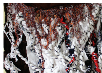
Détail Hyacinthe Ouattara