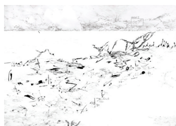
Détail Rada Tzankova

Cloître Ouvert 222 rue du Faubourg Saint-Honoré 75008 Paris Du lundi au dimanche / 8h30 - 20h00 et sur rendez-vous +33 7 68 43 99 79 Fb : @laDGalerie / insta : @d_galerie contact@dgalerie.com